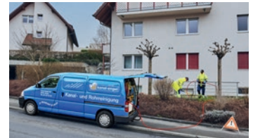
Hausbesitzer / Verwaltungen

Passende Leistungen auswählen und per Fax senden an 041 317 33 17 oder online ausfüllen auf www.kanal-engel.ch :