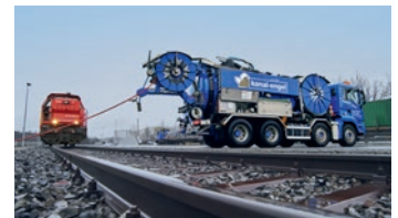
Gewerbe / Industrie